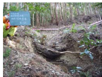
既設作業路整備 雨裂箇所を丸太組で補修