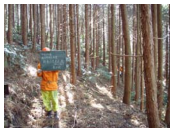
簡易作業路設置 山の整備に欠かせません

これを機会に山の手入れをして「荒廃森林」なんて言葉は返上しましょう。そして活力のあるいい山を共に作りましょう。