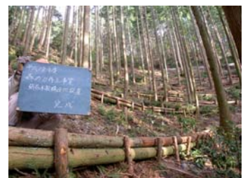
丸太柵設置 土留めの効果を期待