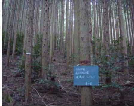
環境伐 (少し強度の間伐) 林を明るくし広葉樹の発生を促す