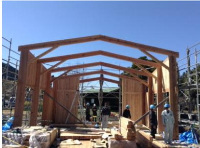
空間は東向きに末広がります