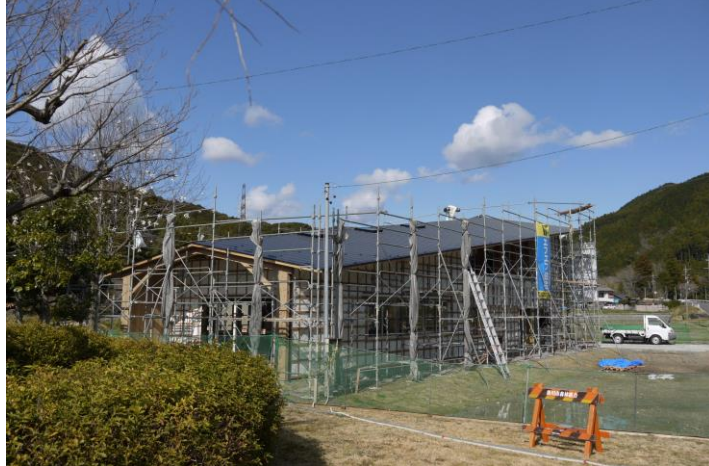
↑ 軒が深く、右肩を上げた空に羽ばたくような屋根のデザイン 屋根の鋼板に採用した色は メタリック・スカンディア・ブルー