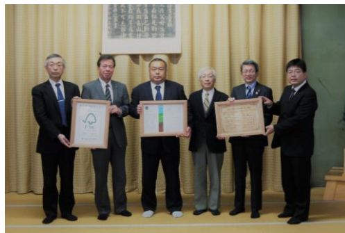
FSCのトレードマーク・認証登録証 行動方針書を持ち合う各代表

式では、今後当グループがFSC認証材を安定的に供給していくため、またその需要を拡大していくための、5者共有の行動方針が発表され、各代表による方針書への署名が行われました。