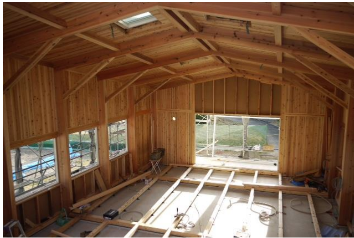
↑ 明るく広々とした事務室空間 事務の作業効率が向上すること間違いなし！