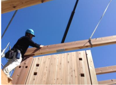
柱と集成パネルと登り梁の接合