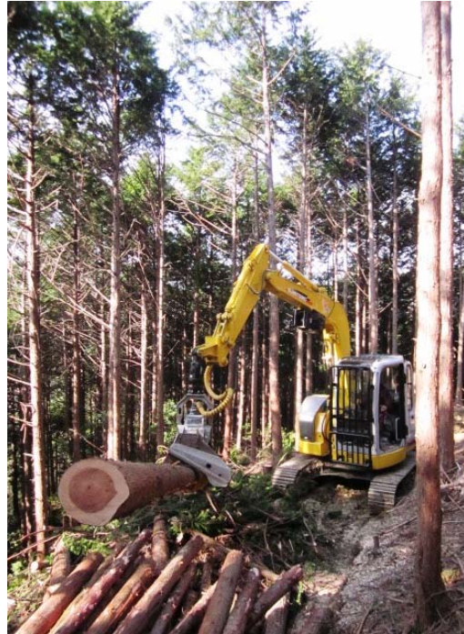
杉の元玉造材状況 根元を掴み、枝払をしながら本をスライドさせて一定の長さでチェンソーが出てきて玉切り

鋭い刃物で枝をそぎ落とします。同時に丸太の長さを測っていて、オペレーターが指示した長さで機械が自動停止。そこでチェンソーボタンを押して丸太を切断します。(下写真②)