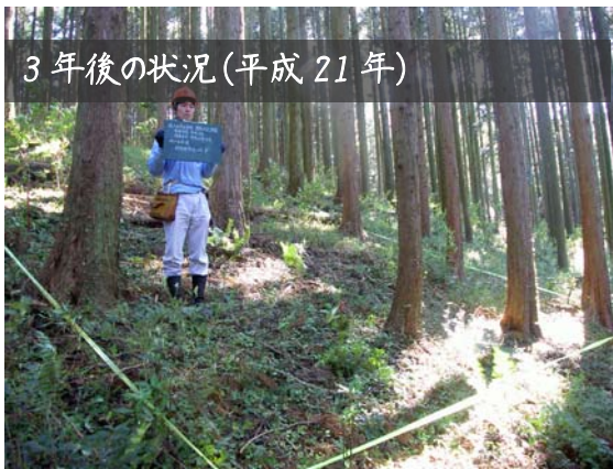
3年後の状況(平成21年)